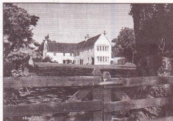
• Glenmorangie House

De Nectar d'Or rijpt door op exclusieve Sauternes witte wijnvaten. Het resultaat is een weelderige, sensuele whisky met een honingkleur. De Glenmorangie 18 Years Old wordt na vijftien jaar deels overgestoken op Oloroso sherryvaten voor de laatste drie jaar rijping. Deze whisky glijdt als zijde over de tong met een vol en rond aroma dat begint met grapefruit en sinaasappel. Heerlijk was ook de Glenmorangie